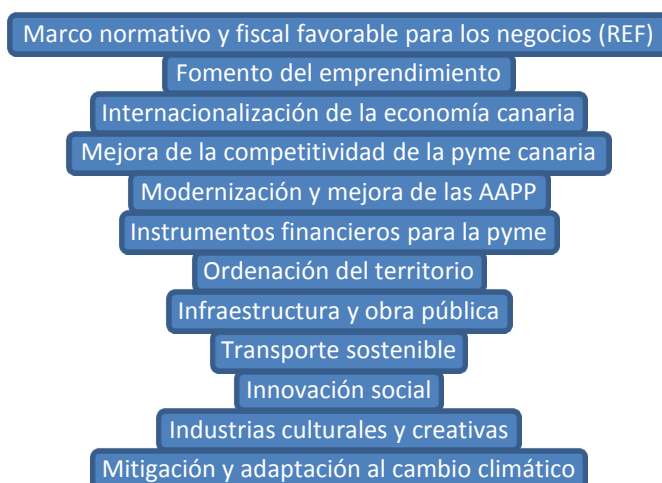
Ilustración 2: Acciones transversales para el desarrollo de la Estrategia Europa 2020 en Canarias

Dichas prioridades se complementan con las siguientes acciones de carácter transversal, que se detallan en el apartado 4.2.